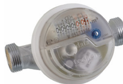
Contatore d'acqua a parete data III