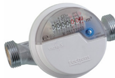
Contatore d'acqua a parete vario S