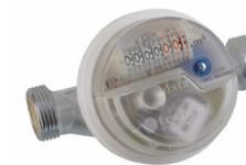
Contatore d'acqua a parete data III